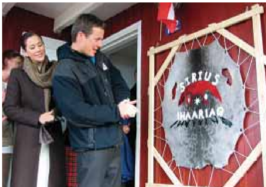
Kronprinsparret indvier »Red Barnets« værested i Qaanaaq